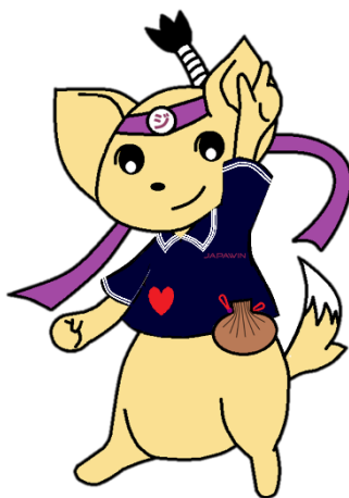
ジャパウインゆるキャラ「ジャジャ」

神奈川県川崎市川崎区東田町5番地3ホンマビル8階（川崎市役所前） TEL 044-221-0037（代表） FAX 044-221-0038 MAIL recruit@japawin.jp HP https://www.japawin.jp/